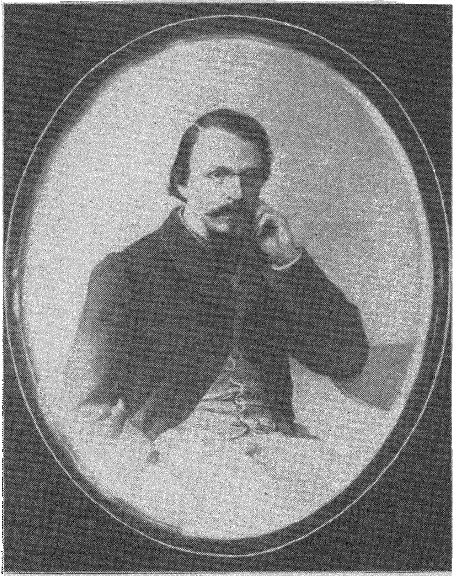
М. М. Достоевский. Фотография 1864 г.

туда выслали денег. Ты же в своем письме от 14-го а октября обещал мне выслать хоть несколько денег с следующей почтой. «Итак, он получил деньги, — подумал ты. — Следовательно», не нуждается, а потому и письма ему не надо писать». Хорошо, друг мой! Но не говорил ли я тебе, не писал ли, что мне не деньги нужны от тебя, а память и внимание братские. Ты мне писал, что дела твои худы, что денег у тебя нет. Неужели я не могу понять, что ты, человек семейный, обязанный многими заботами, можешь не иметь для меня денег! И какое право имел бы я претендовать на тебя за неприсылку денег, тогда как ты один помогал и поддерживал меня до сих пор! Разве я не знаю и не понимаю всю тяжесть твоих забот по твоим же письмам! И потому пойми, что я ропщу на тебя не потому, что ты обещал мне денег и не прислал (я знаю, что если не прислал, так верно их не было; в твоей доброте и в твоём сердце я не сомневаюсь).