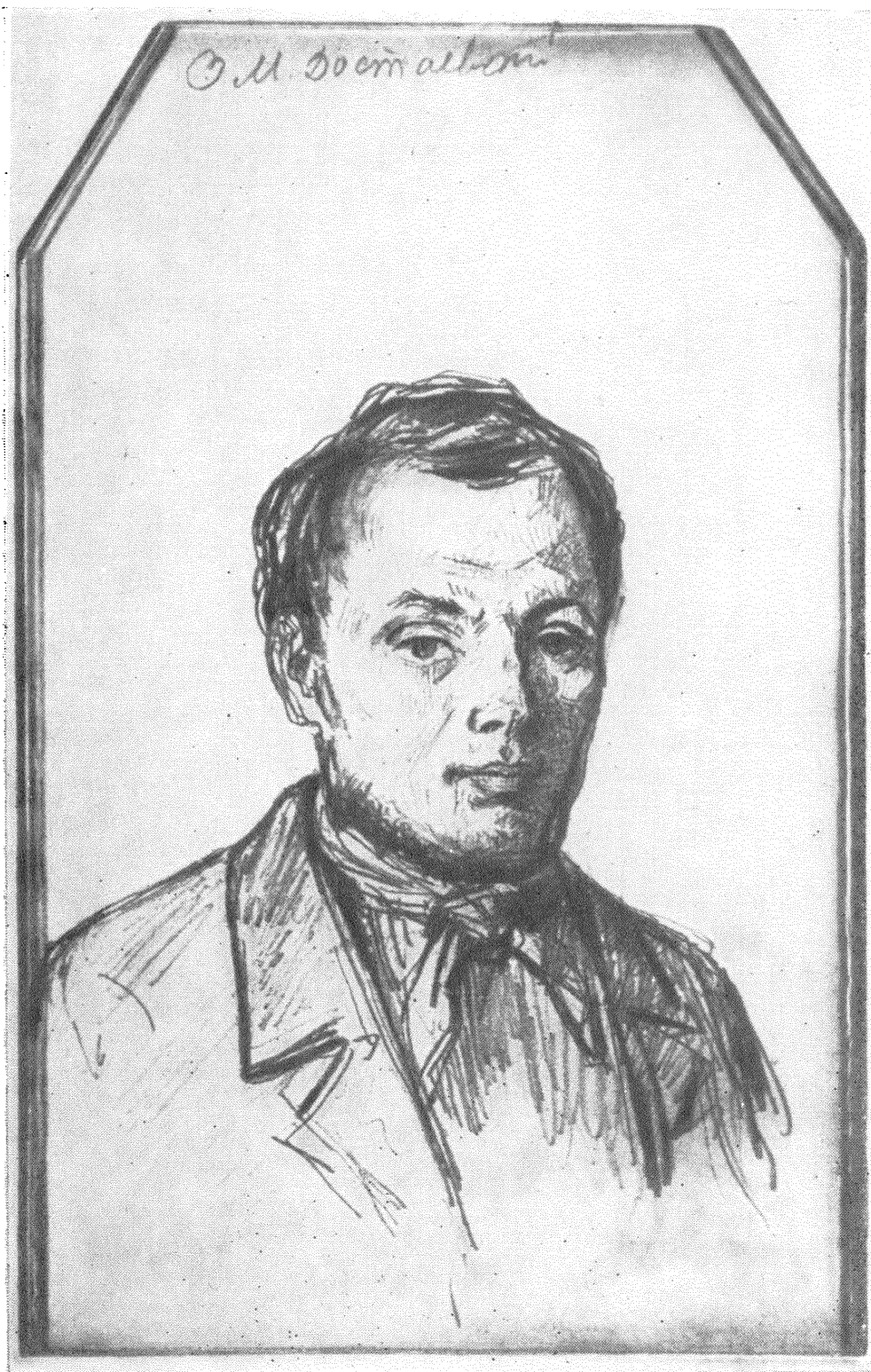
Ф. М. Достоевский Набросок К. А. Трутовского 1847 г. Гослитмузей (Москва).