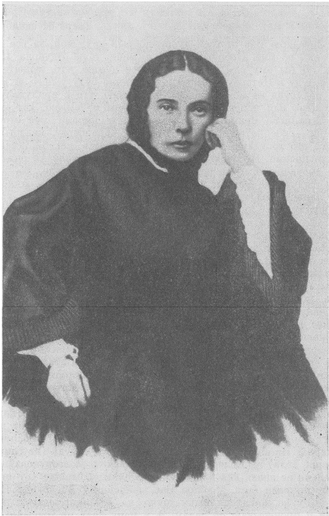
М. Д. Достоевская.

Фотография конца 1850-х—начала 1860-х годов.